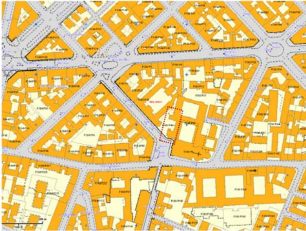
Inquadramento catastale: foglio 365 mappale 47