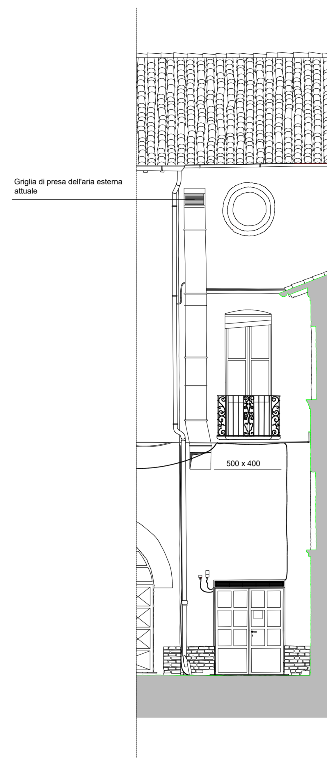
CANALE DELL' ARIA ESTERNA da modificare